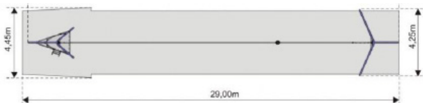
Vy från sidan med höjder/djup (m)