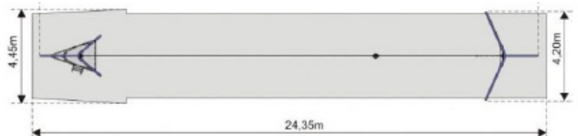
Vy från sidan med höjder/djup (m)